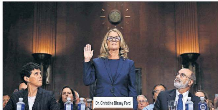
“EL ATAQUE DE KAVANAUGH MARCÓ MI VIDA”, Christine Blasey Ford, la profesora de California de 51 años que acusa de abusos sexuales a Brett Kavanaugh, el candidato de Donald Trump para el Tribunal Supremo, prestó ayer testimonio bajo juramento en el Senado de EE.UU. “Al 100% fue él quien me asaltó”, dijo. Entonces ella era menor. “Me ha impactado en los últimos 36 años de mi vida”, PÁGINAS 2 Y 3

El ministro de Ciencia y Universidades, Pedro Duque, afirmó ayer que no hay nada legal en el uso de una sociedad patrimonial para la posesión de dos inmuebles en Madrid y en Javea (Alicante). Y subrayó que “no hubo un ahorro real de impuestos”. Duque también afirmó que pagaba un alquiler por su uso, lo que llamó un “autoalquiler”. Pero las cuentas de Copenhagen Gestores de Inmuebles no reflejan esos pagos. La sociedad, creada en 2005, solo declaró ingresos entre 2011 y 2014, según datos presentados en el Registro Mercantil. La norma obliga a imputar rentas de alquiler a precio de mercado. PÁGINA 19