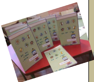
LOS MINILIBROS DE INFANTIL

Libros de Poesía, Cuentos y Adivinanzas que fueron poco a poco trabajándose en el aula para terminar en ... "Minilibros" o pequeñas obras de arte realizadas con su propio esfuerzo y dedicación