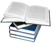
LA BRUJA QUITAVOCALES

La actividad de iba a poner a nuestros niños y niñas ante una gran encrucijada... ¿Cómo resolver el gran misterio de la Bruja Quitavocales, que necesitaba de estas para poder elaborar su poción mágica... ¿Quién sería lo suficiente valiente para poder luchar y ganar esta batalla?