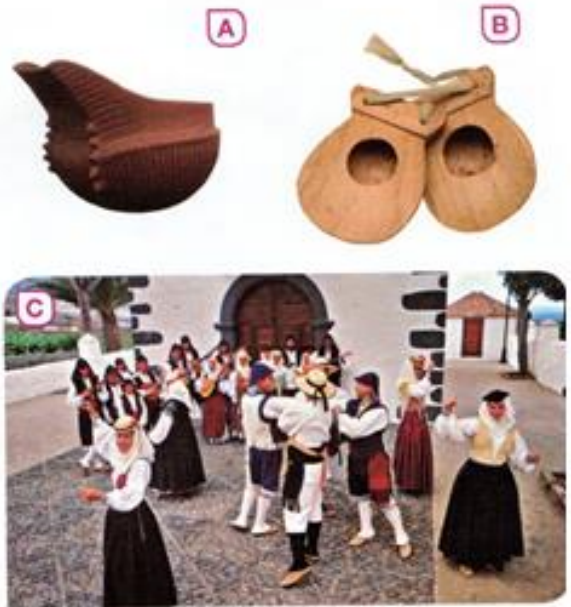
2 Folclore de Canarias. A. Cerámica de Fuerteventura. B. Chácaras. C. Baile y trajes típicos de Breña Alta, en La Palma.

El folclore, las fiestas y los monumentos nos ayudan a recordar el pasado de la localidad en la que vivimos.