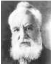
Alexander Graham Bell

5 Realiza las operaciones y averigua quién descubrió qué, uniendo con flechas las operaciones que dan el mismo resultado.