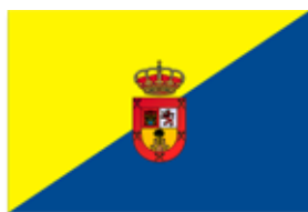
BANDERA DE GRAN CANARIA