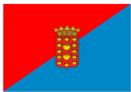
BANDERA DE LANZAROTE