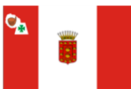
BANDERA DE LA GOMERA