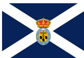
BANDERA DE TENERIFE