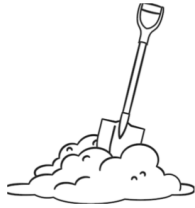
soil and dirt