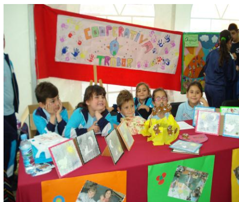
Cooperativa escolar Tróbor Infantil 3, 4 y 5 años

Además, este sistema de trabajo, potencia la capacidad creativa y es una vía de conocimiento innovadora, activa, cercana, integradora y fomenta la actitud emprendedora, permitiendo el trabajo cooperativo, demanda la toma de decisiones conjuntas, el respeto y cumplimiento de los acuerdos y capacita para ser consumidores responsables y comprometidos con el medio ambiente. Todo ello teniendo en cuenta que es un soporte ideal para el desarrollo de valores: cooperación, responsabilidad e iniciativa, donde poder insertar el trabajo en las Áreas Curriculares.