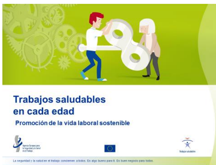
Figura 2. Imagen de La campaña «Trabajos Saludables» 2016-2017 de la Agencia Europea para la Seguridad y la Salud en el Trabajo.

de la campaña y guías multimedia relativas al tema de la campaña.