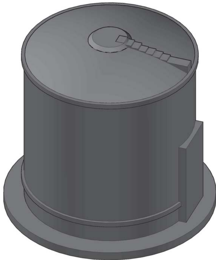
PERSPECTIVA 3D DE LA ESTRUCTURA GENERAL DEL DIGESTOR ESCALA 1:250