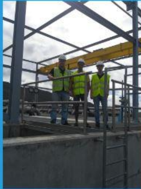
Sistema de membranas BRM