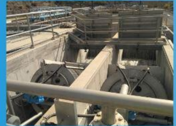
Tamizado de superfinos