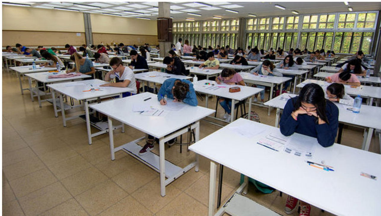
Evaluación del Bachillerato para el Acceso a la Universidad (EBAU) 2017 en la ULPGC FLICKR ULPGC

Con el pseudónimo de La Perejilla , destacó por su agresiva y burlesca poesía. Con un vocabulario poco habitual para su época, fue un personaje muy popular en la capital de la Isla en aquellos tiempos y sus improvisaciones han logrado incorporarse en la cultura popular canaria. Su poemario, en su mayoría improvisado, se reunió en un libro gracias a Néstor Álamo, que, en 1963, los publicó en la obra titulada Poesía . En 1897, con 77 años, Agustina falleció en su ciudad natal.