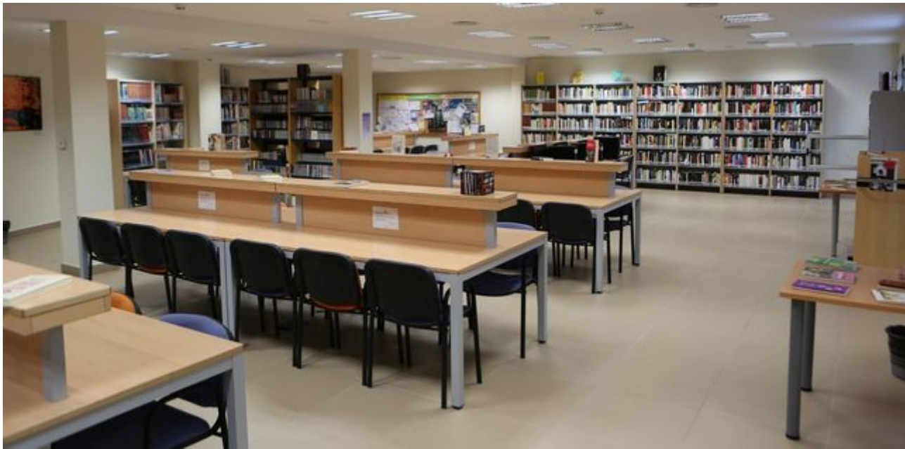
Biblioteca de Arucas ALEJANDRO RAMOS

Entre sus publicaciones se encuentran Escenas, paisajes y personajes herreños (1983); La pulsera de Galanas (1984); Lucía en las playas (1988); Cuentos y leyendas de la Bajada de la Dehesa (1985) o El habla común de El Hierro (1985). Flora Lilia Barrera ha obtenido galardones como el Premio de Poesía Pedro García Cabrera y el Primer Premio La Sabina de Oro de El Hierro . Su único libro de poemas se titula Pequeño beso de la isla (1987).