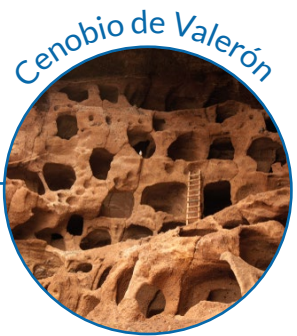
Cenobio de Valerón