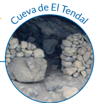
Cueva de El Tenda