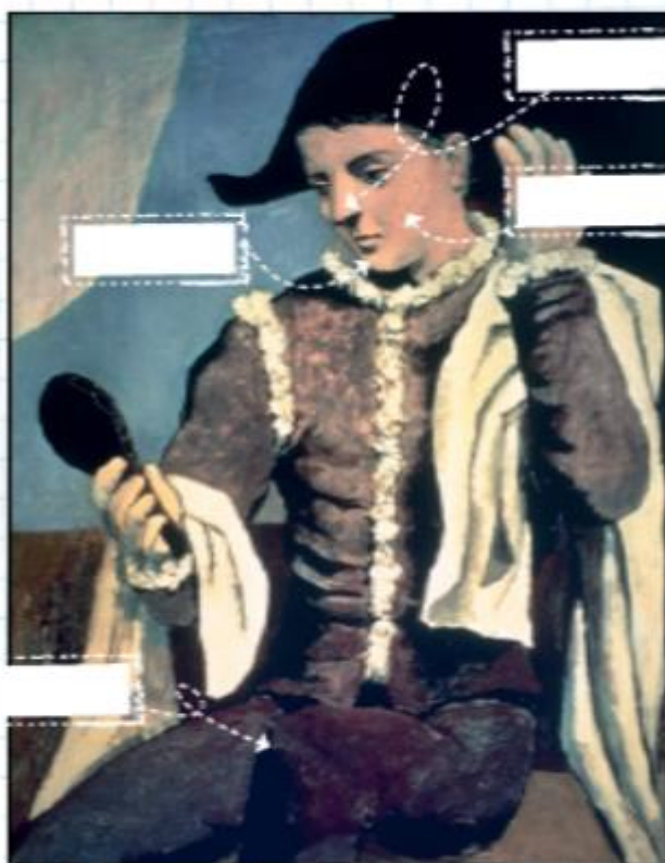
Picasso, Arlequín con espejo , Museo Thyssen-Bornemisza.