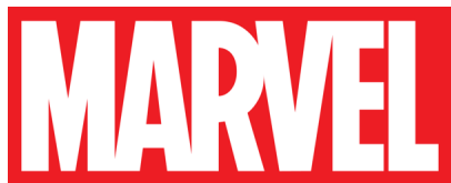
Imagen de Marvel

Si eres fanático de las películas de superhéroes y los cómics, con toda seguridad estás familiarizado con el logo de Marvel. Hace más de 10 años que lo vemos en la gran pantalla cada vez que sale una nueva cinta y, como puedes ver, sus colores y tipografía son imposibles de ignorar: el contraste entre el rojo y el blanco y el espacio que ocupan las letras hacen de este logo toda una declaración que esencialmente nos dice que, así como sus héroes, Marvel no es algo de lo que te olvidarás rápidamente.