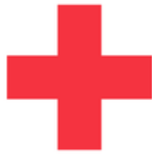
Imagen de Cruz Roja

Este logo fue diseñado por Henri Dunant en 1883, así que se trata de uno de los más longevos de esta lista. Y es también uno de los más universales, porque esta imagen aparece en muchos de los servicios de salud y emergencia de algunos países en el mundo, con algunas variaciones para distinguirse de otras banderas o identidades. Su origen se remonta a la primera Convención de Ginebra, de 1864. De ahí que se parezca a una versión «en negativo» de la bandera de Suiza.