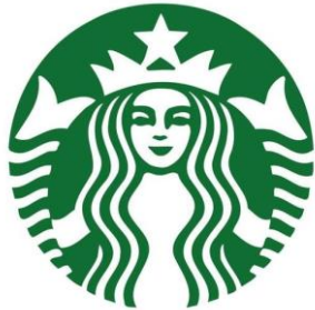
Imagen de Starbucks

Además, su tono verde sólido habla de avance y seguridad, y todo mundo quiere iniciar su día así.