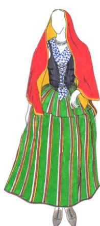
Vestido tipo de Fiestas Las Palmas de Gran Canaria E. XXI - XX