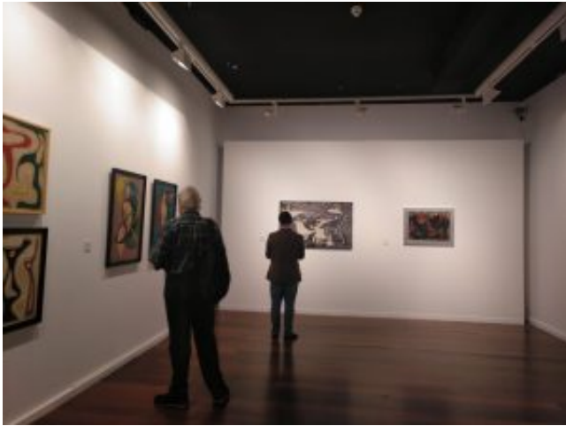
Cabrera Pinto - Expo Pino Ojeda - visita sala

Las salas Cabrera Pinto, en La Laguna, ofrecen dos propuestas expositivas hasta el próximo 5 de julio. En la primera planta la dedicada a la faceta plástica de Pino Ojeda, bajo el comisariado de Ángeles Alemán, invita al espectador a adentrarse en el rico universo plástico de la polifacética artista grancanaria, de quien se ha conocido mucho más su obra literaria. En paralelo, la planta superior del espacio, acoge la exposición 'Goya y otros grandes grabadores', organizada por el centro, que incluye algunas obras de Francisco de Goya.