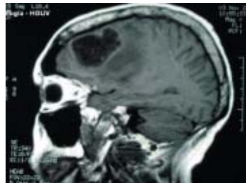
Fig. 2. TAC cerebral corte sagital: absceso cerebral. Brain CT scan, sagittal slice: cerebral abscess.