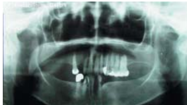
Fig. 3. Ortopantomografía. Proceso infeccioso periapical del 23. Orthopantomography. Periapical infection of the 23.