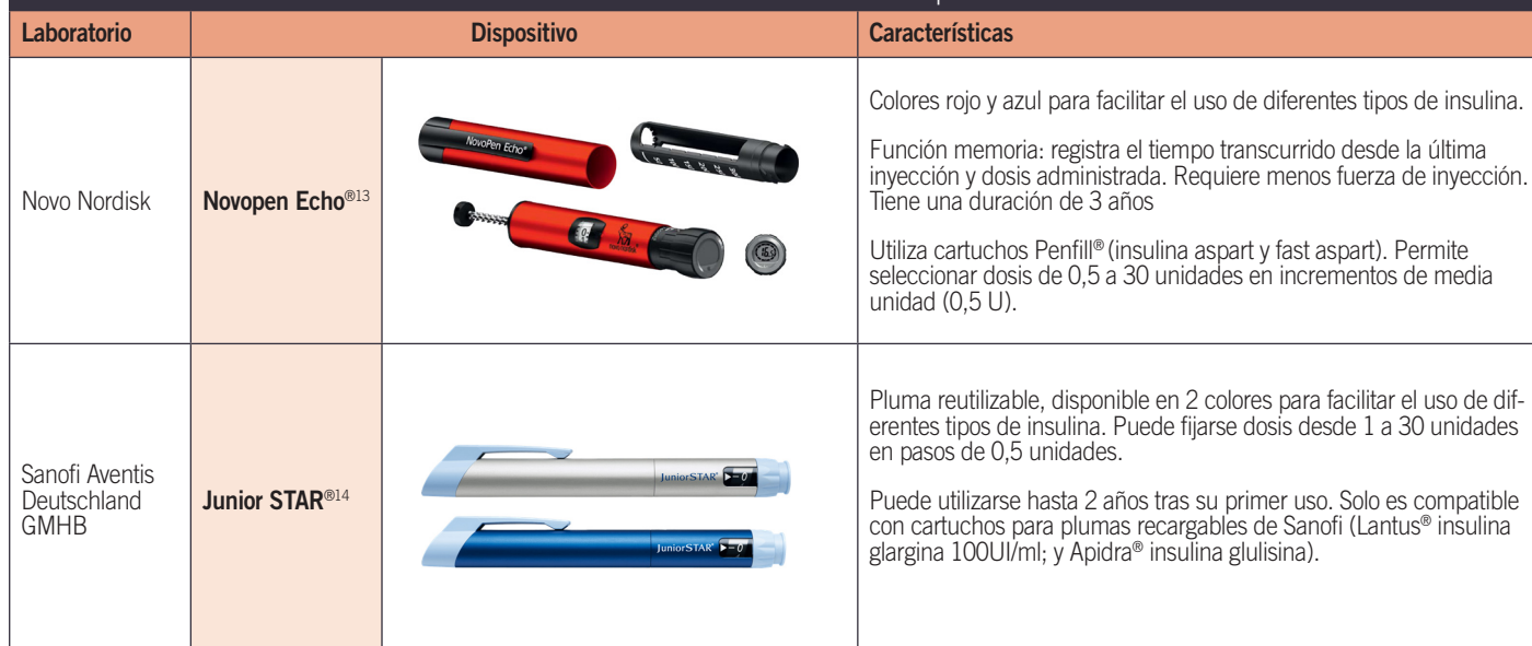
Tabla 3. Plumas dosificadoras de insulina reutilizables comercializadas en España

Presenta la posibilidad de cambiar el cartucho de insulina cuando este se acaba. Son recargables y por lo general pueden durar hasta 2 o 3 años desde su primera utilización.