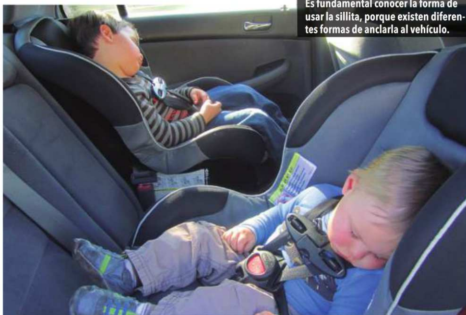
Es fundamental conocer la forma de usar la sillita, porque existen diferentes formas de anclarla al vehículo.